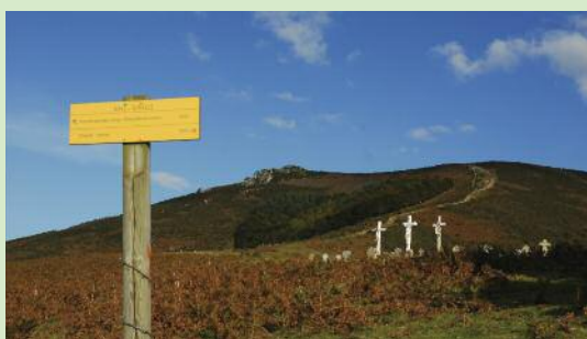
Panoramique sur les croix du calvaire

R andonnée qui offre à plusieurs reprises de magnifiques vues panoramiques sur l'océan, les montagnes alentour et Ainhoa.