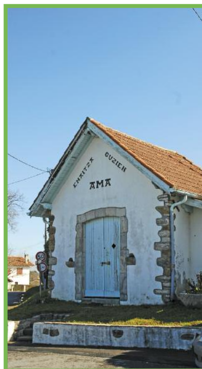
La petite chapelle