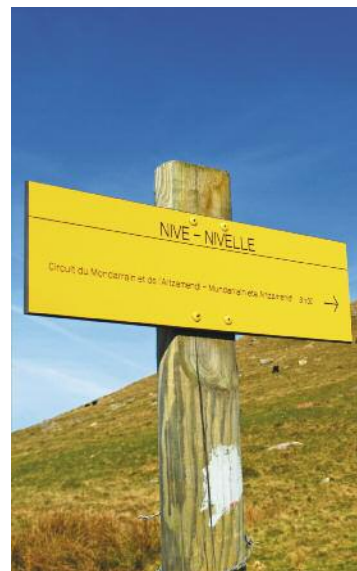
Une photo locale des sentiers ou balisage

Durée de la randonnée : La durée de chaque circuit est donnée à titre indicatif. Elle tient compte de la longueur de la randonnée, des dénivelées et des éventuelles difficultés.