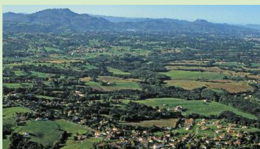
Vue aérienne d'Arbonne

Cet itinéraire agréable alterne entre prairie et sous bois. La nature de la végétation indique que l'eau est présente en abondance dans le sol.