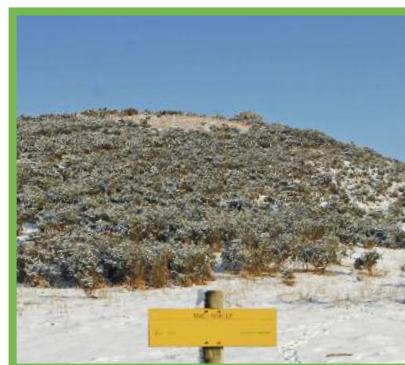
Balisage au pied de la redoute d'Olhain