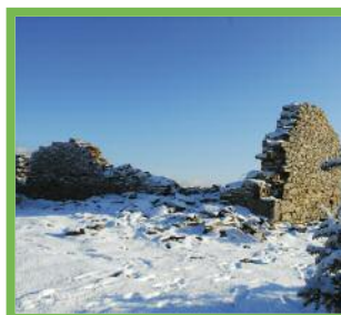
Ancienne Chapelle d'Olhain

Olhain est séparée de la Rhune par un col qui était un lieu de passage pastoral. Il ne reste plus que des ruines de la chapelle, vestiges d'un édifice relativement important qui devait mesurer 20 m x 8.80 m. Ce lieu, pourrait avoir été, selon les anciens de Sare, le refuge d'un ermite entre 1793 et 1813. Les habitants de la région, très attachés à leurs traditions, continuèrent, pendant de longues années à se rendre en procession sur cet emplacement, en particulier la veille de l'ascension. La Chapelle d'Olhain est entourée par les ruines d'une redoute de forme pentagonale dont deux côtés font plus de 25 mètres. (extrait du livre Autrefois Sare par J. Antz, éd. Atlantica 2005)